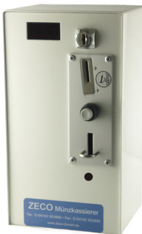
Hochwertiger Münzeinwurf ist Sonderzubehör