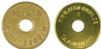
Miele T.-Nr. 1699370 / Zeco 370 passend für Miele-T.-Nr. 1699370