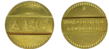
AEG Wertmarke / Zeco Nr. 7 passend für AEG Wertmarke