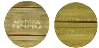
Aqua Wertmarke / Zeco Nr 8 passend für Aqua Wertmarke