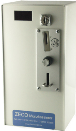
Hochwertiger Münzeinwurf ist Sonderzubehör