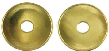
Miele T.-Nr. 11724 / Zeco 724 passend für Miele-T.-Nr. 11724