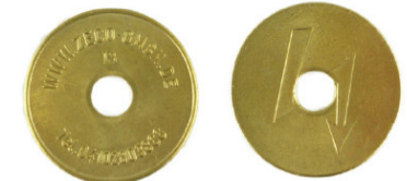
Blitz Wertmarke 26x1,6 mm