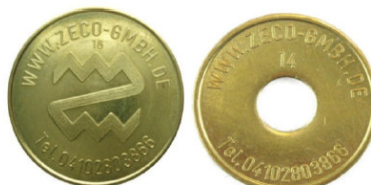
Seijsener Wertmarke / Zeco Nr. 14 passend für Seijsener Wertmarke