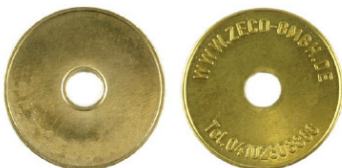
Miele T.-Nr. 11721 / Zeco 721 passend für Miele-T.-Nr. 11721