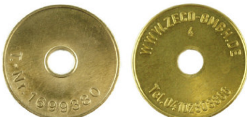
Miele T.-Nr. 1699380 / Zeco 380 passend für Miele-T.-Nr. 1699380