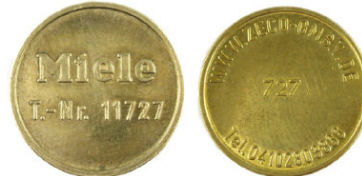
Miele T.-Nr. 11727 / Zeco 727 passend für Miele-T.-Nr. 11727