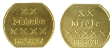
Miele T.-Nr. 685827 Miele T.-Nr. 685828