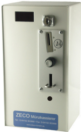
Hochwertiger Münzeinwurf ist Sonderzubehör