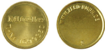
Miele T.-Nr. 1699350 / Zeco 350 passend für Miele-T.-Nr. 1699350