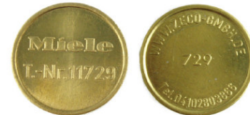
Miele T.-Nr. 11729 / Zeco 729 passend für Miele-T.-Nr. 11729