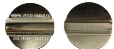
Schellka / Zeco AM7