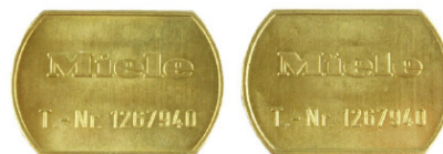
Miele T.-Nr. 1267940