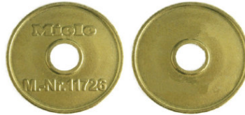
Miele T.-Nr. 11726 / Zeco 726 passend für Miele-T.-Nr. 11726