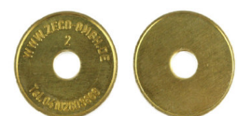
Größe von 0,20 €, 0,50 €, 1,00 €, 2,00 €