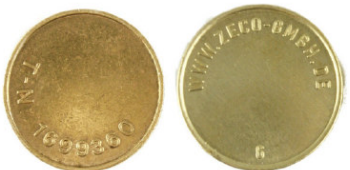
Miele T.-Nr. 1699360 / Zeco 360 passend für Miele-T.-Nr. 1699360