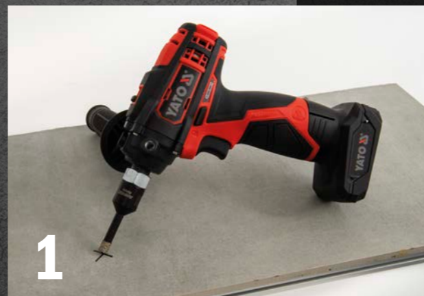
1 Maschine auflegen