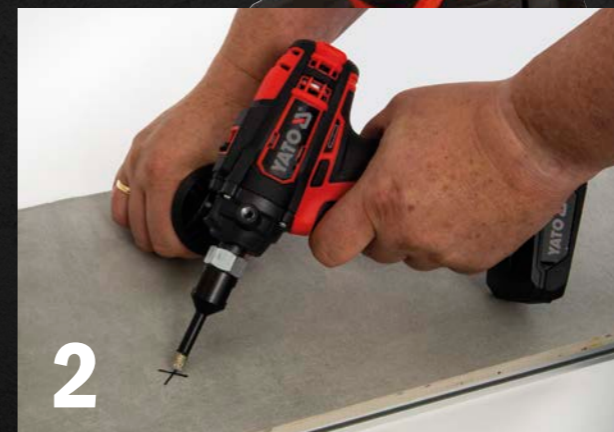
2 Festhalten und Anbohren