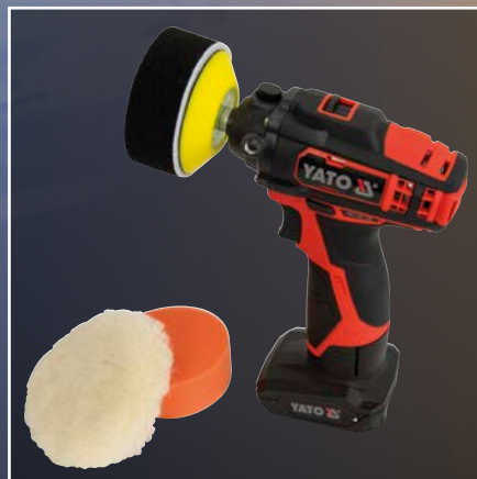
Akku Schnellläufer mit verschiedenen Polierpads