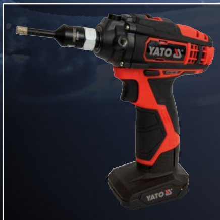
Akku Schnellläufer mit DIAMANT Fliesenbohrer „BRIdiamondDrill“ Größe Ø 8 mm